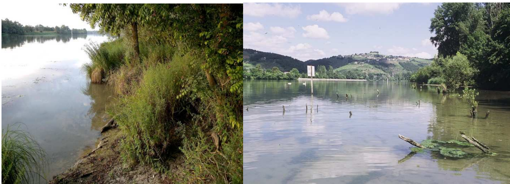
Figure 2. L'habitat larvaire de Gomphus flavipes , (a) la Saône à Peyzieu (01), (b) le site de Plaine de Gerbay sur le Rhône (38)

Ce secteur de l'île de la Platière présente un fonctionnement particulier du fait de sa situation en entrée de lône et par suite de son surcreusement et de son élargissement qui sont intervenus au début des années 1980 dans le cadre d'un projet halieutique. Il se comporte depuis ces travaux comme un « piège à sable ». Le suivi disponible depuis 1988 (PONT et al. 2004) documente bien cette accumulation progressive de sable et la dynamique de ces alluvions dont la localisation et le profil sont modifiés à chaque crue. Cette lône abrite dans ses parties à courant nul ou faible d'importants herbiers aquatiques à Vallisneria spiralis , Najas marina , Ceratophyllum demersum et, depuis quelques années, Elodea nuttallii . Son peuplement odonatologique est bien connu (PONT et al. 2004) avec comme espèces dominantes : C. s. splendens , E. lindenii , E. viridulum , P. pennipes , I. elegans , G. vulgatissimus , O. f. forcipatus , O. cancellatum et Anax imperator . On y observe plus localement Coenagrion puella (Linnaeus, 1758), Boyeria irene (Fonscolombe, 1838), Libellula fulva O.F. Müller, 1764, L. depressa , Orthetrum coerulescens (Fabricius, 1798), Crocothemis erythraea (Brullé, 1832) et Sympetrum striolatum . En 2009, la reproduction d' Oxygastra curtisii a été découverte sur cette lône.