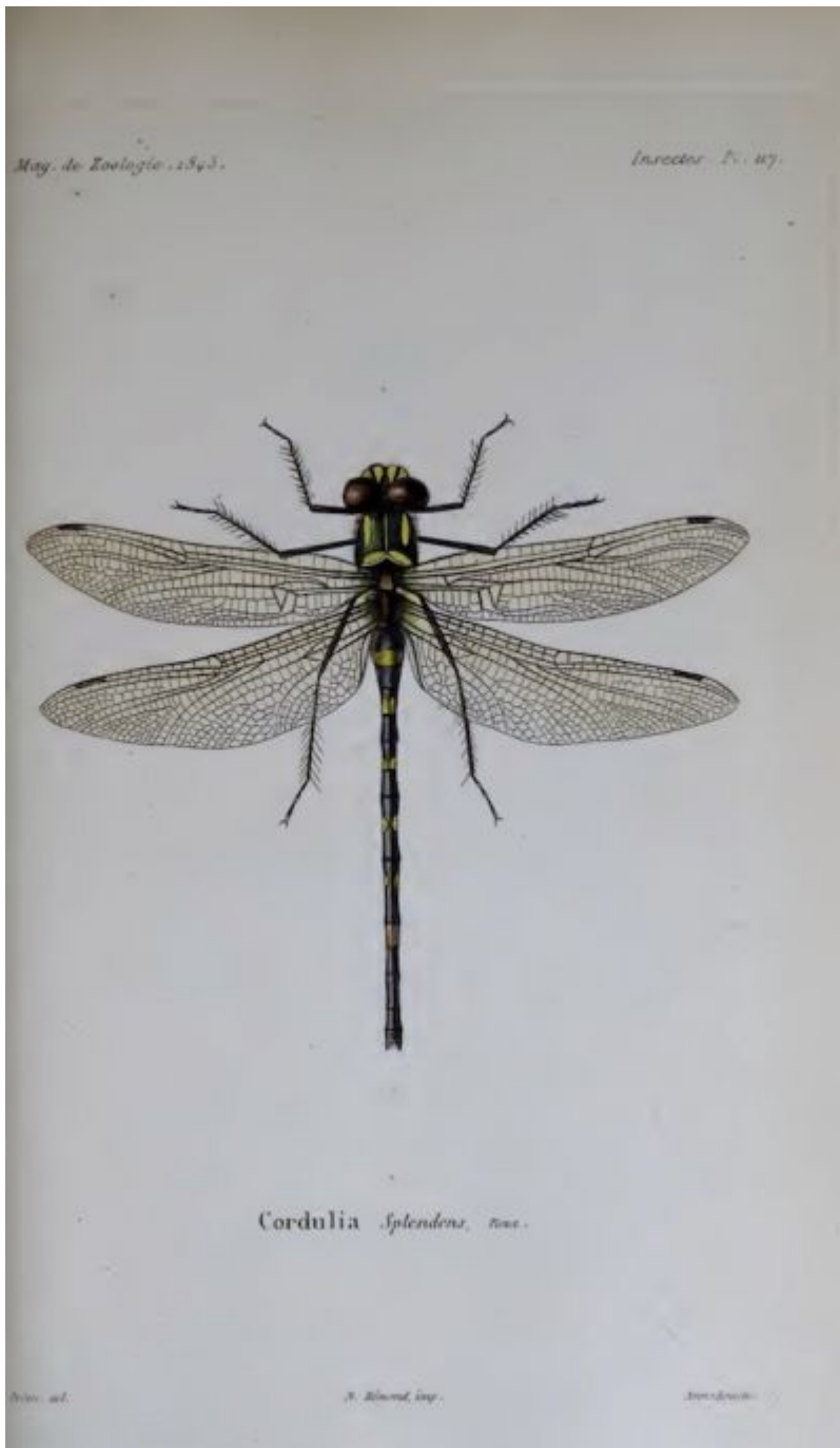
Planche originale de la description de Pictet de la Rive & Selys (1844)